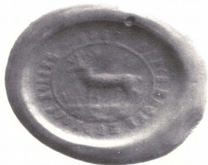
Pečať z roku 1867